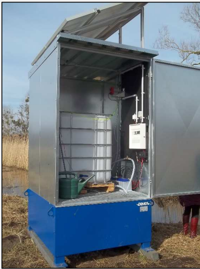
Abb.1: Phosphat-Fällanlage (Steuerteil, Vorratsbehälter, Pumpen und Energieversorgung)

Installation und Betrieb von einer Phosphat-Fällanlage in der Kleinen Peene kurz vor der Einmündung in den Teterower See zur Reduzierung der dem See zufließenden Phosphorfracht