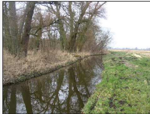
Abb.4: Thürkower Bach kurz oberhalb der Mündung in den Teterower See