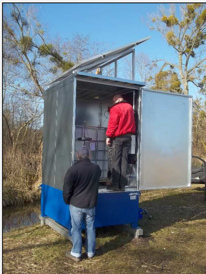
Abb.5: Installation der Anlage im März 2014