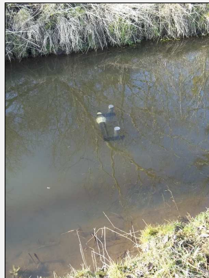
Abb.6: Injektionslanze im Thürkower Bach