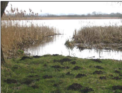
Abb.3: Mündung des Thürkower Baches in den Teterower See