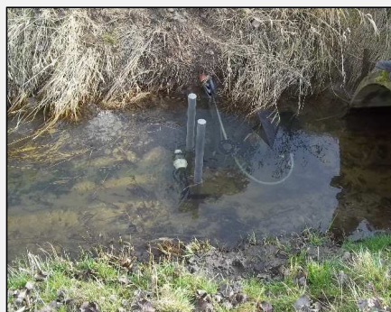
Abb.8: Injektionslanze zur Injektion von P-bindendem Fällmittel in die fließende Welle des Zulaufs