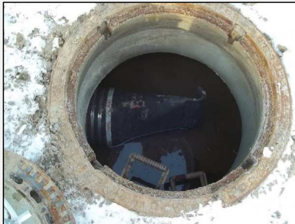
Abb.5: Schacht mit Rückschlagventil als Überlauf zum Teich