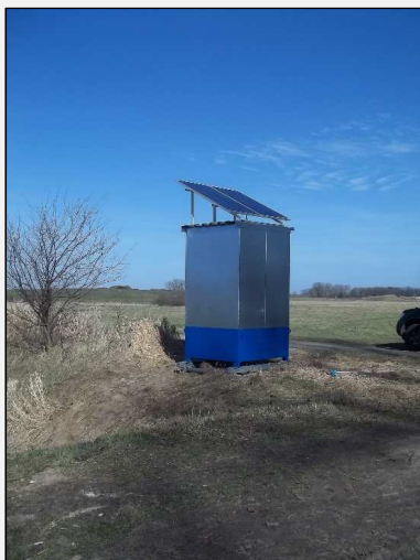
Abb.7: Umhausung der Phosphatfällanlage am Pampower Graben