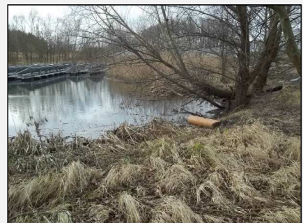
Abb.3: ehemaliger Schönungsteich