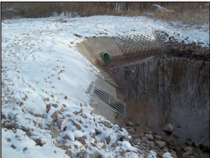
Abb.4: Einlaufbauwerk zur Rohrleitung mit Überlauf zum Teich