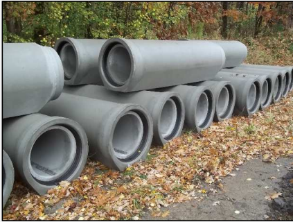
Abb.1: Material für die Rohrleitung