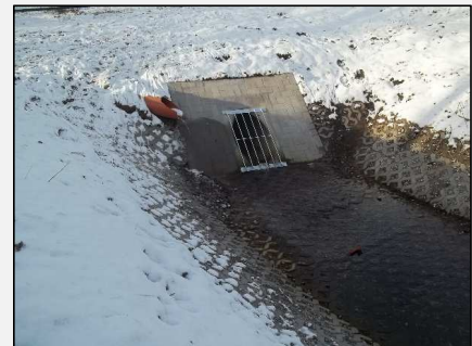
Abb.6: Auslaufbauwerk in den Zulauf zum Pampower Graben