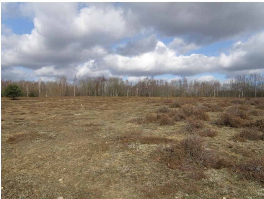
Abb 3: Pflegeeinsatz in der Karender Heide: Beräumte Fläche, wo vorher Landreitgras dominierte (linke Bildseite) im Vergleich zu belassenen Heideflächen

Die Kalißer Heide entstand auf einem ehemaligen Schießplatz. Südlich des Platzes befindet sich eine Ackerfläche, die derzeit extensiv genutzt wird und eine Pioniervegetation aufweist. Aufgrund der geologischen Entstehung handelt es sich um „ Sandheiden mit Besenheide und Ginster auf Binnendünen “ (EU-Code 2310) und um „ Offene Grasflächen mit Silbergras auf Binnendünen “ (EU-Code 2330).