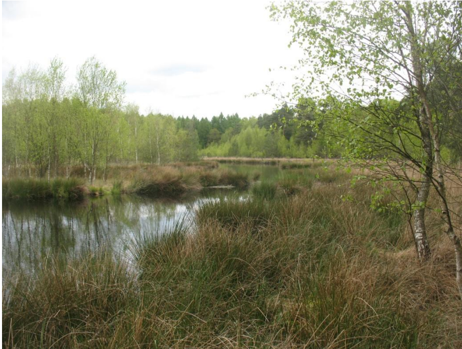
Abb. 2: Das Wiebendorfer Moor mit Blick über das flache Randgewässer auf das inselartige Zentralmoor.

Lebensraumtyp „ Übergangs- und Schwingrasenmoore “ (EU-Code 7140) eingestuft und das ringartige Gewässer gehört zum Lebensraumtyp „ dystrophe Seen “ (EU-Code 3160) mit einer typischen Unterwasser- und Schwimmblattvegetation. Die bräunliche Färbung des Wassers deutet auf einen hohen Gehalt von Huminsäuren hin. Das eigentliche Moor weist eine charakteristische Vegetation mit Torfmoosen und Seggen auf.