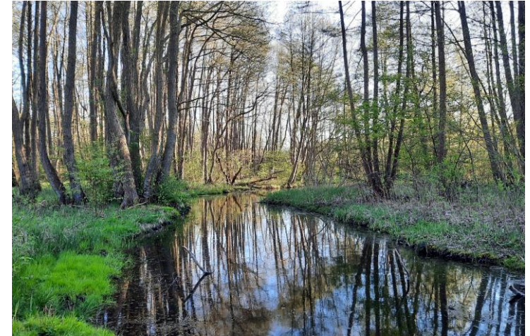
Krebsbach in Schwerin